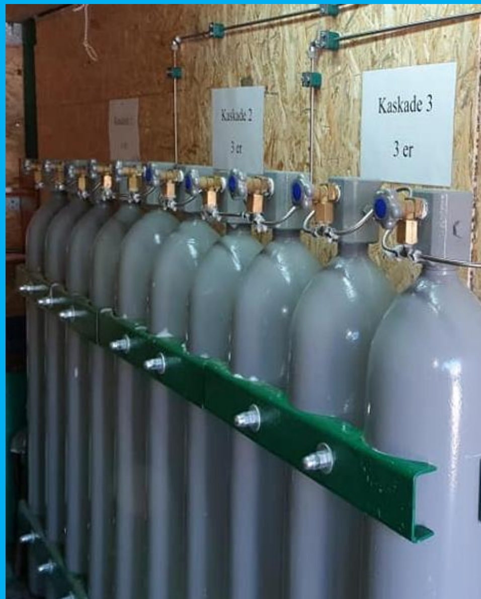
Kaskadni sustav banke zdraka