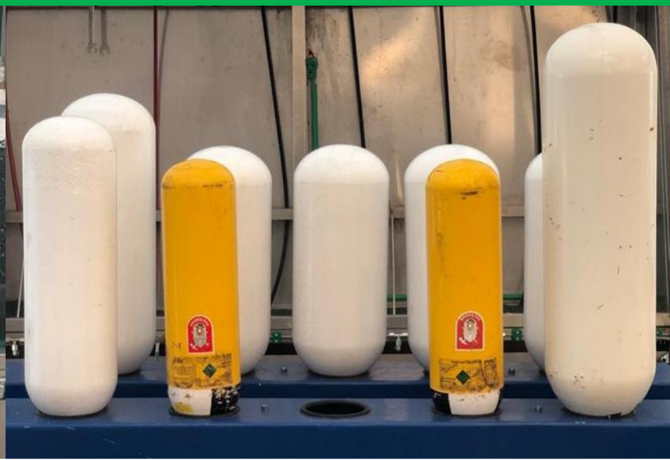
Unutarnje sušenje tlačne posude