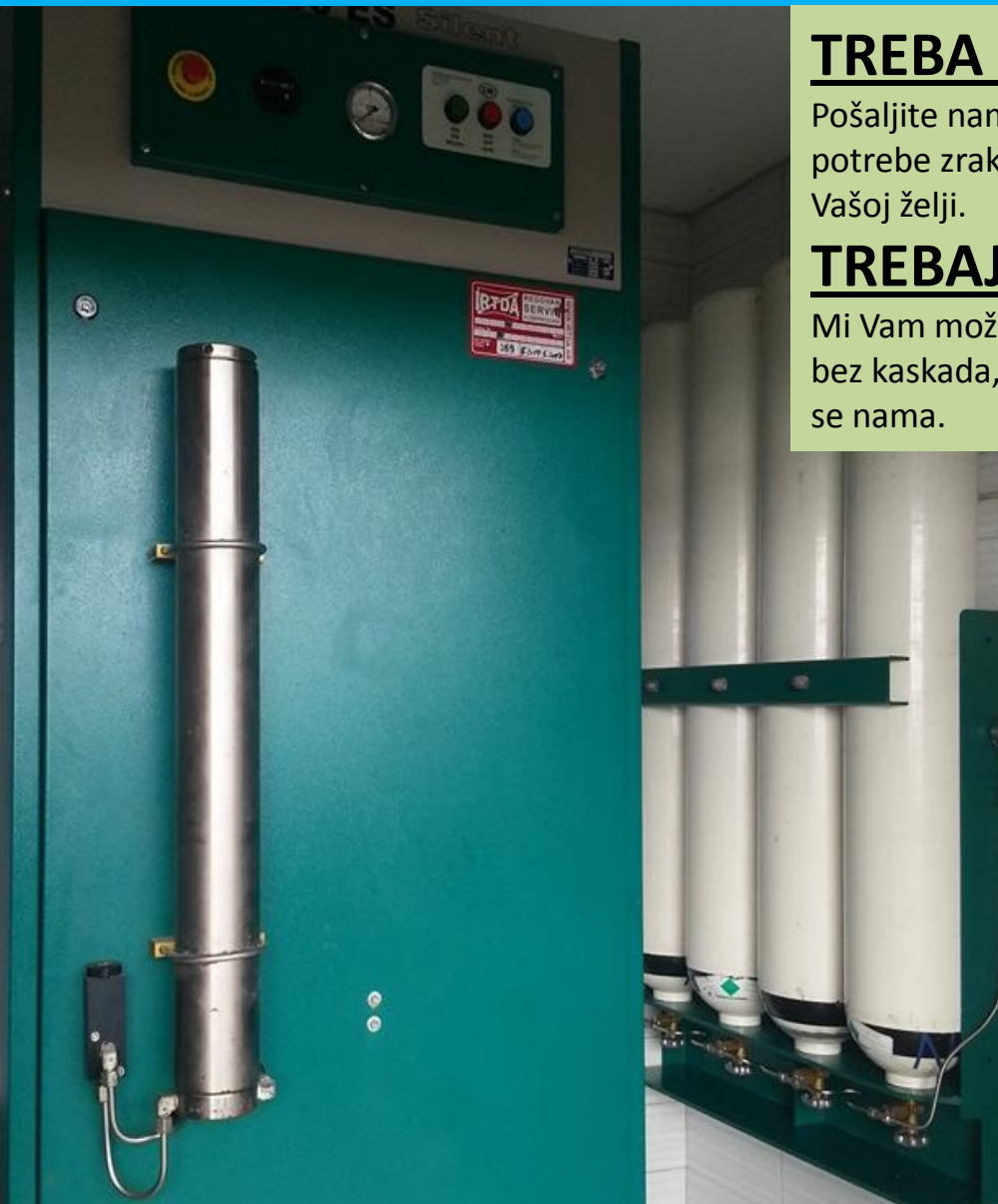
Profesionalne banke zraka

Mi Vam možemo složiti po proračunu kompletan sustav banke zraka s ili bez kaskada, s jednim ili dvije tlačne potrebe, za zrak, Nitrox. Obratite se nama.