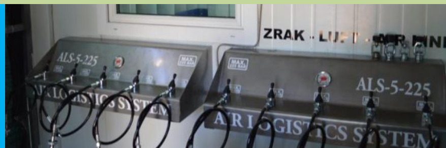
Paneli za punjenje od V4 prokorma