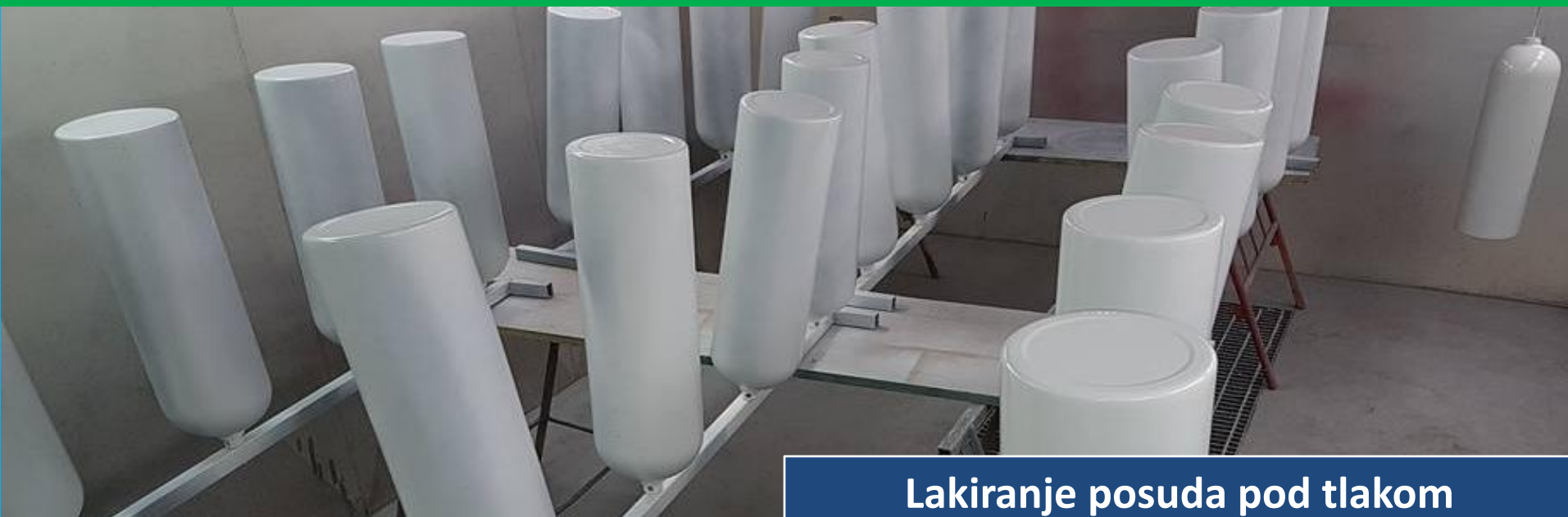
Lakiranje posuda pod tlakom

Nudimo vam regeneracije posuda pod tlakom.