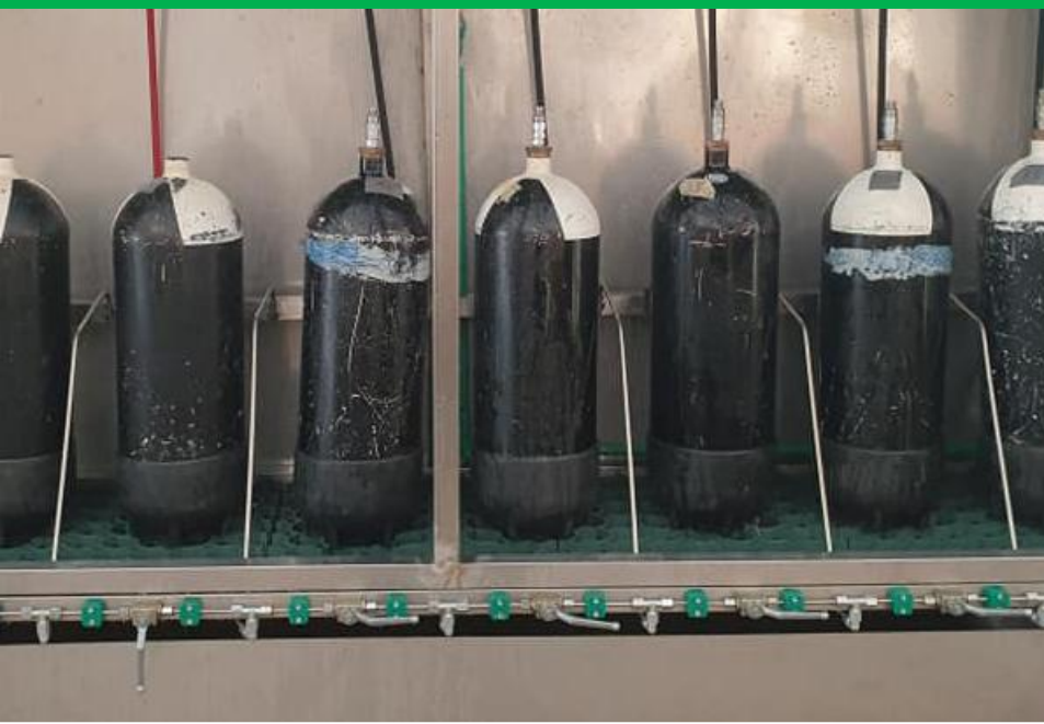
Ispitni sustav za posude pod tlakom

MI DOLAZIMO PO VAŠE POSUDE UNUTAR CIJELE HRVATSKE!