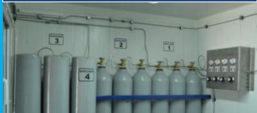
Kaskadna banka zraka